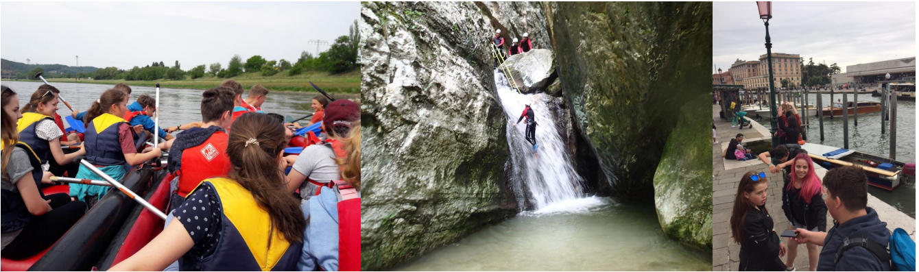
Abendteuer auf dem, im und am Wasser. Die Klassen 8 und 9 nehmen wertvolle Erfahrungen von ihren Reisen mit.

unternahm die Klasse 9. Die als Abschlussfahrt konzipierte Busreise war mit Sightseeing in Venedig, einer aufregenden Wildwasserwanderung durch einen Canyon und einem turbulenten Tag im Erlebnispark voll bepackt. Nur ganz knapp blieb dabei noch Zeit für das wohlverdiente „Chillen“ am Strand des wunderschönen Gardasees.