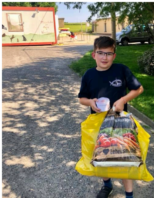
Schwer bepackt zum Wohle der Tiere.

Nun wartet zum Schuljahresabschluss eine spannende Projektwoche auf unsere Schüler. Neben klasseninternen Exkursionen und Projekten sowie altersgemischten Workshops, wird uns die afrikanische i-Themba-Gruppe am Dienstag einen Besuch abstatten. Deren Berichte, Theaterstücke, Diskussionsrunden und musikalische Einlagen werden unseren Tag, der mit einem kleinen Grillfest in unserer Schulgemeinschaft abgeschlossen werden soll, sicher bereichern. Dabei werden auch der obligatorische Bücherbasar für gut erhaltene Schulbücher sowie der Verkauf gebrauchter Schulkleidung stattfinden. Auch zukünftige Schüler und Eltern sind dazu herzlich eingeladen.