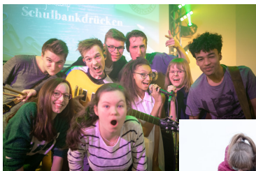
Ehemalige und viele aktuelle Schüler beteiligen sich aktiv am Jugendcamp beim Schulbankdrücken.