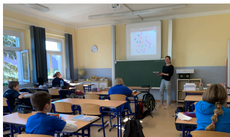
Es gibt für (fast) alles eine App - nun funktioniert das sogar kabellos.

Frischer Wind zog während der Winterferien in unsere Klassenzimmer ein. Zur technischen Überbrückung bis zur Installation der vorgesehenen Smartboards wurden in allen